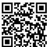
桃園市國民小學藝術才能美術班 鑑定線上報名系統