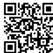
桃園市國民小學藝術才能國樂班 鑑定線上報名系統