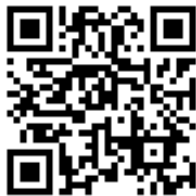
桃園市國民小學藝術才能國樂班 鑑定線上報名系統

主辦單位：桃園市政府教育局 承辦學校：桃園市平鎮區忠貞國民小學 地 址：桃園市平鎮區龍南路 315 號 電 話：(03)4501450 分機 610、611、613 傳 真：(03)4508944 網 址： https://www.jjes.tyc.edu.tw/